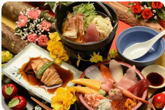
さかなセンターお食事メニュー

◆海鮮丼（鮭赤身・とろびんちょう鮭・ねぎとろ・ウニ・イクラ・釜揚げ桜えび・釜揚げしらす・いか・白身魚・サーモン・甘海老・玉子）◆まぐろトロ煮込み ◆カニ鮎入り漁師鍋