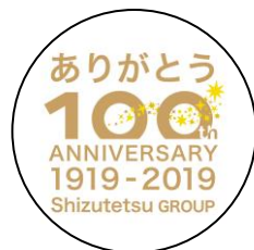
創立100周年記念ロゴヘッドマーク