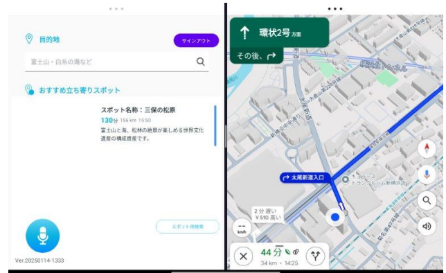
おすすめスポットへの案内