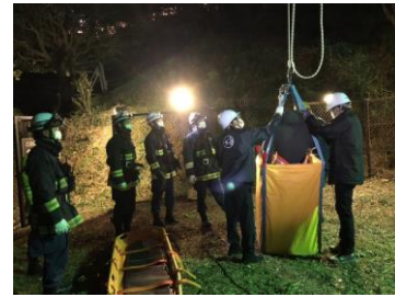
前回の訓練の様子